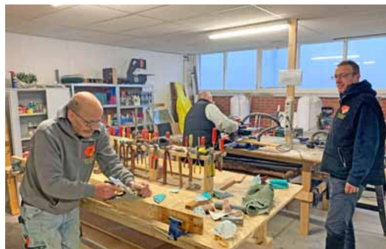
De Hulpexpress is een van de deelnemers aan Project 3

Het is de bedoeling dat het wijkbedrijf een plek wordt met verschillende activiteiten waarmee jij als Beijumer je talenten leert ontdekken en ontplooien. Waar je trainingen kunt volgen om makkelijker de stap naar werk te kunnen maken. Een centrale plek in de wijk waar je terecht kunt met vragen over werk, en waar je begeleiding kunt krijgen. Zo'n wijkbedrijf moet een opstap zijn om werkervaring op te doen.