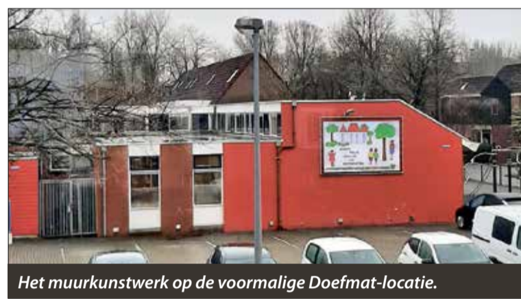
Het muurkunstwerk op de voormalige Doefmat-locatie.