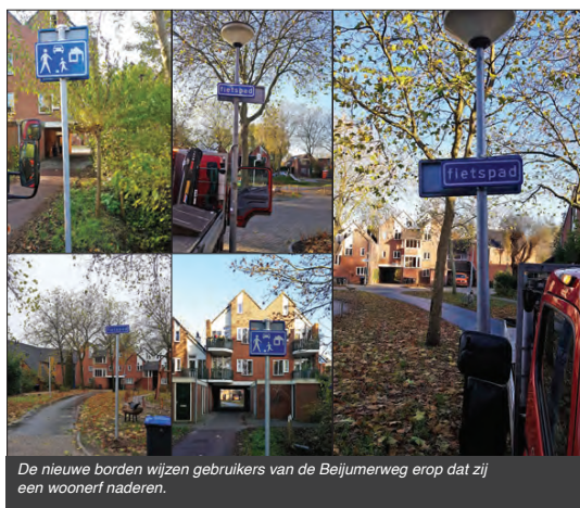
De nieuwe borden wijzen gebruikers van de Beijumerweg erop dat zij een woonerf naderen.

De Grevingaheerd is een woonerf met in het midden een speelplek voor kinderen. Volgens de wet is het woonerf de plek van voetgangers en fietsers. Auto's mogen er maximaal 15 kilometer per uur rijden. Parkeren mag alleen in de parkeervakken.