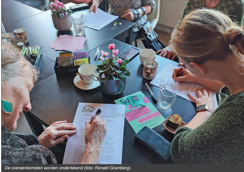
De overeenkomsten worden ondertekend.

En zo ontstond het idee voor een logo dat duidelijk maakt wat er allemaal gedaan wordt met de bedragen van het Wijkbudget. Daar wordt nu aan gewerkt.