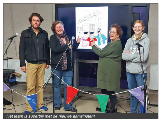
Het team is superblij met de nieuwe aanwinsten!