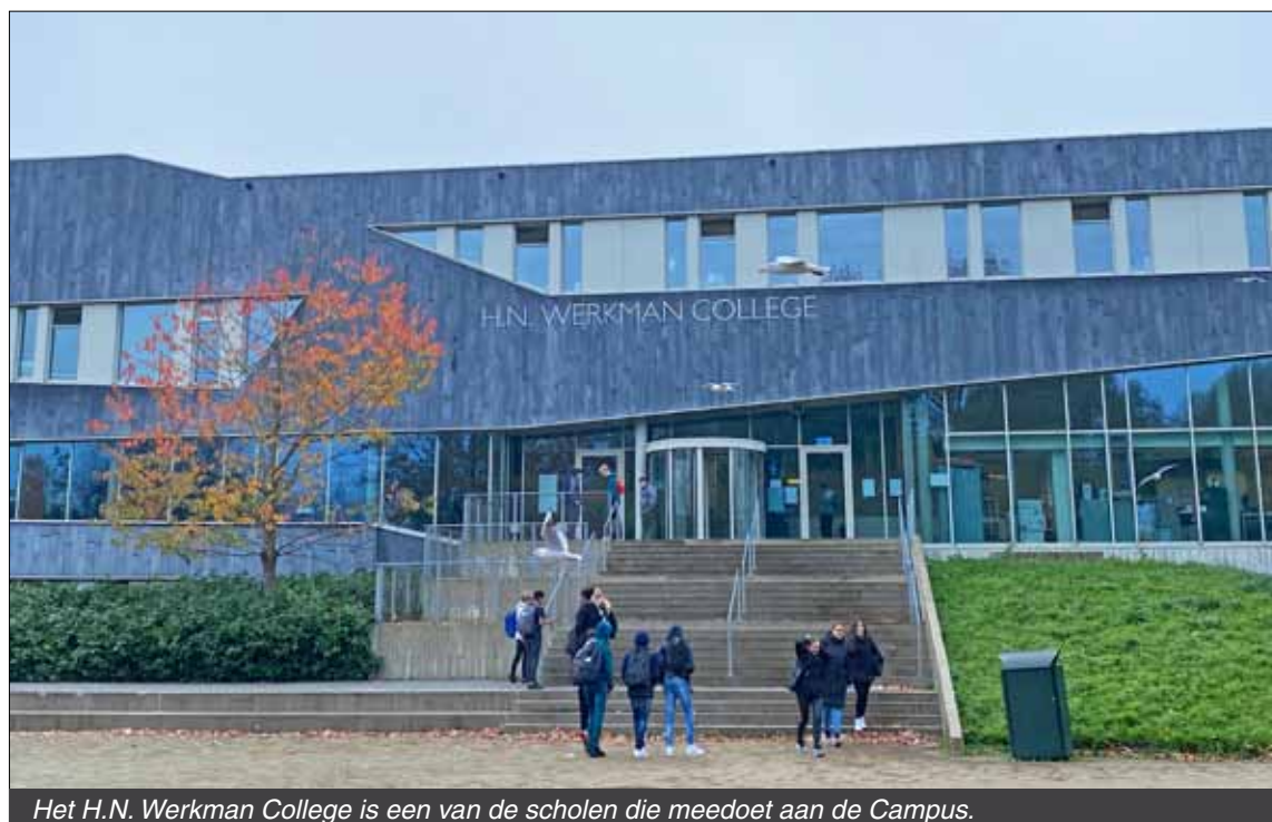
Het H.N. Werkman College is een van de scholen die meedoet aan de Campus.